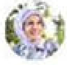
Emine Erdoğan @EmineErdoğan

Kaybolmaya yüz tutmuş zengin dokuların korunması ve dünyaya açılması için gösterilen her gayretin destekçisi olmayı sürdüreceğim. @bursaolgunlasma atölyelerinde, Bursa'nın kadim tarihini ilmek ilmek işleyen maharetli elleri yürekten kutluyorum. @tcmeb #TürkiğnesininMucizesi