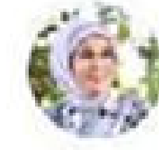
Emine Erdoğan @EmineErdoğan

ÖS 4:10 · 15 May 2022 · Twitter for iPhone